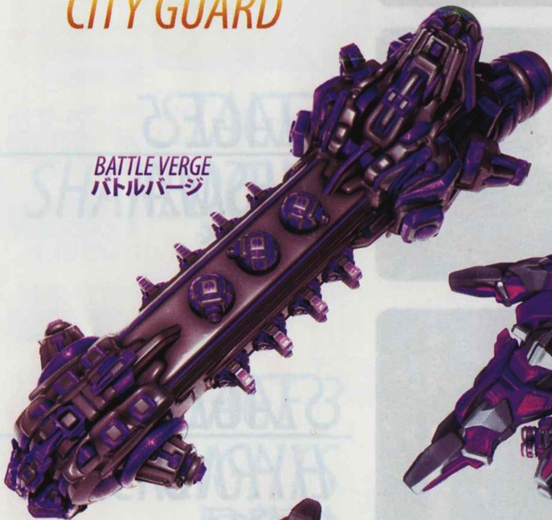
BATTLE VERGE バトルバージ